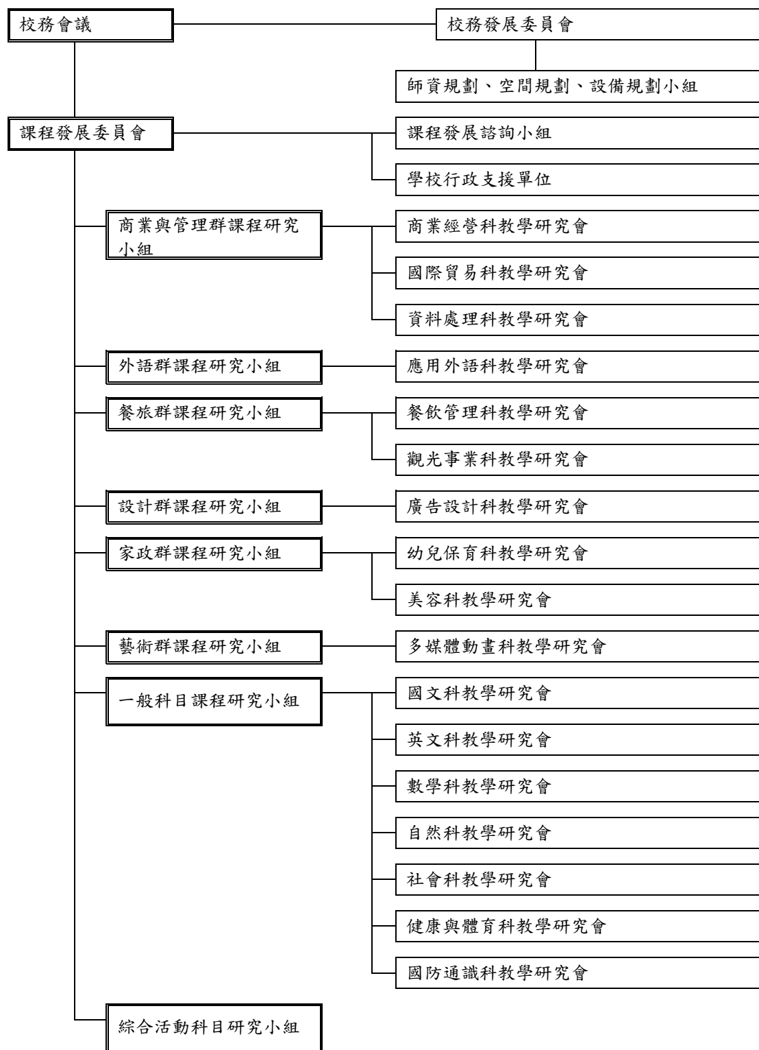
圖 1 課程發展組織架構圖