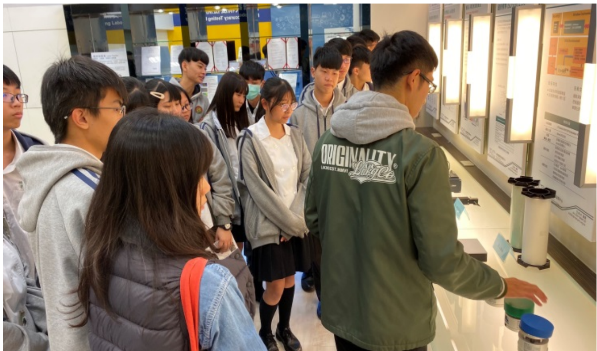
機械檢測展示說明