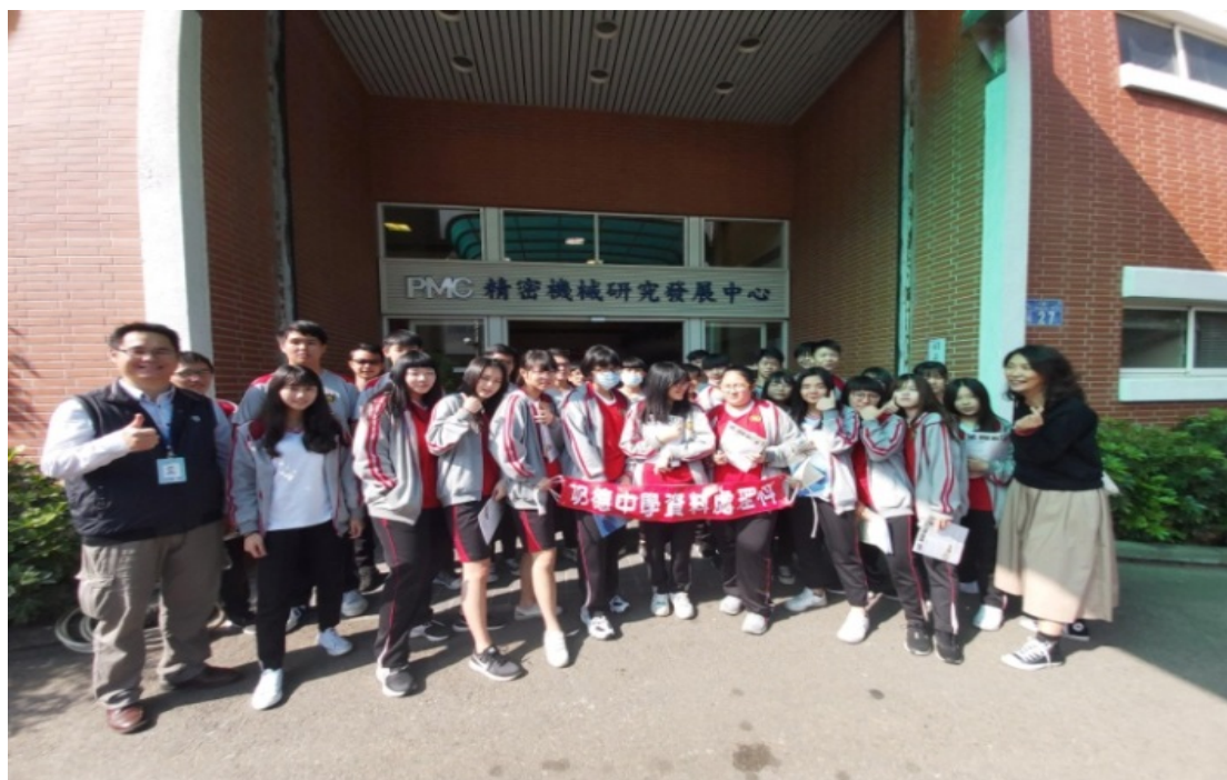
一年級學生及副處長大合照