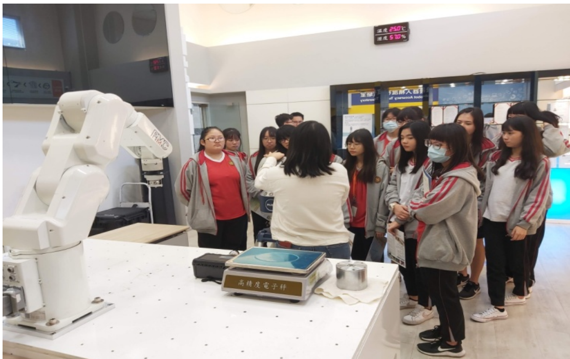
機器人精度檢驗實驗室