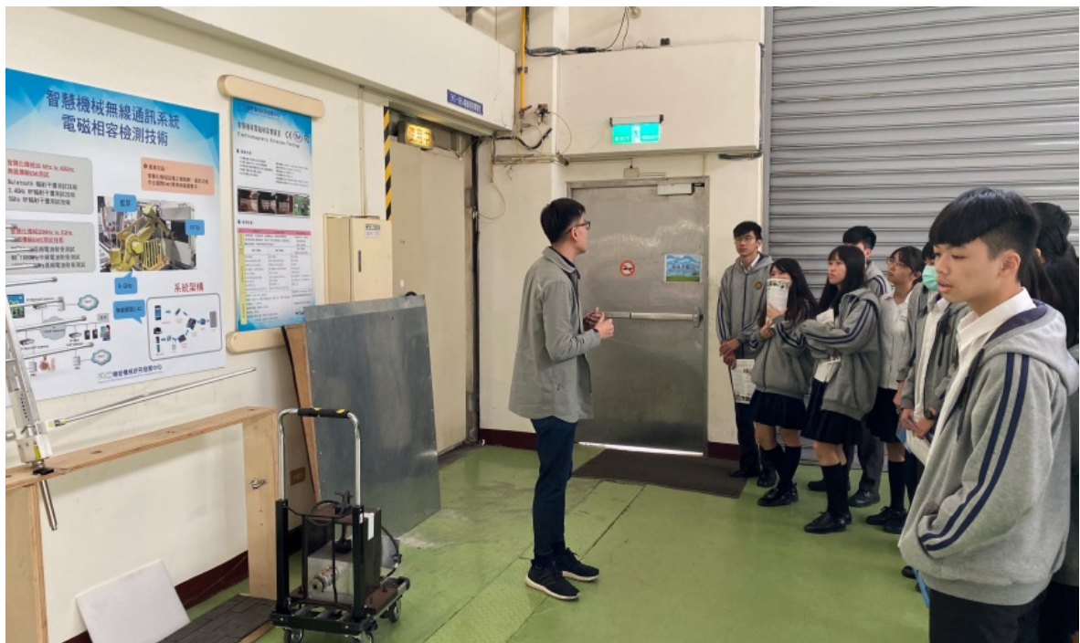
無線通訊系統檢測技術說明