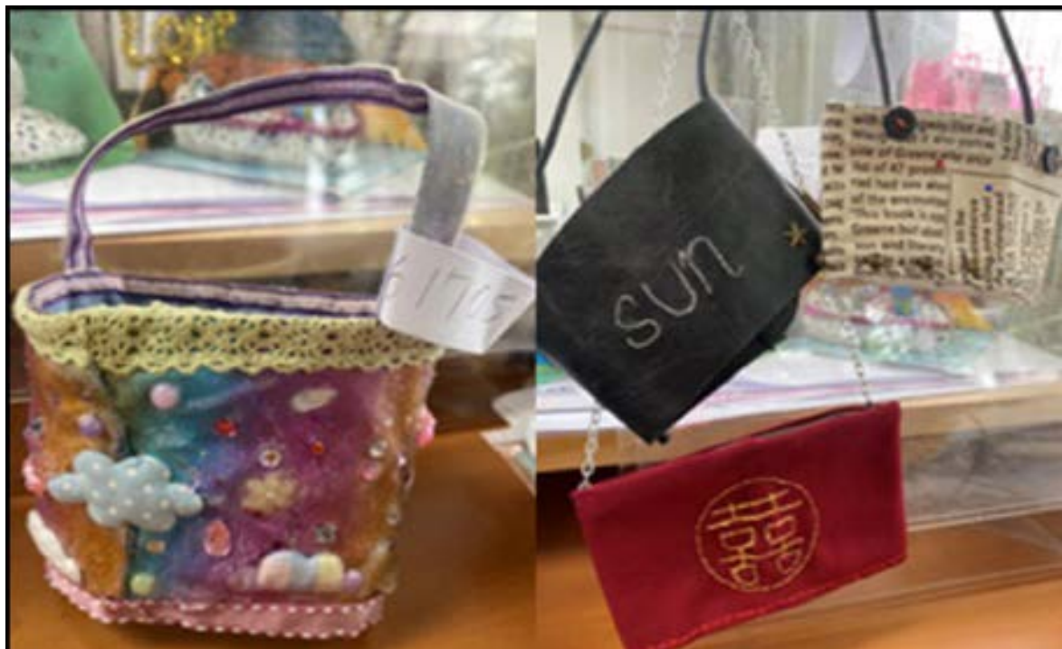
師生共同完成與眾不同，具有獨創性的杯袋設計