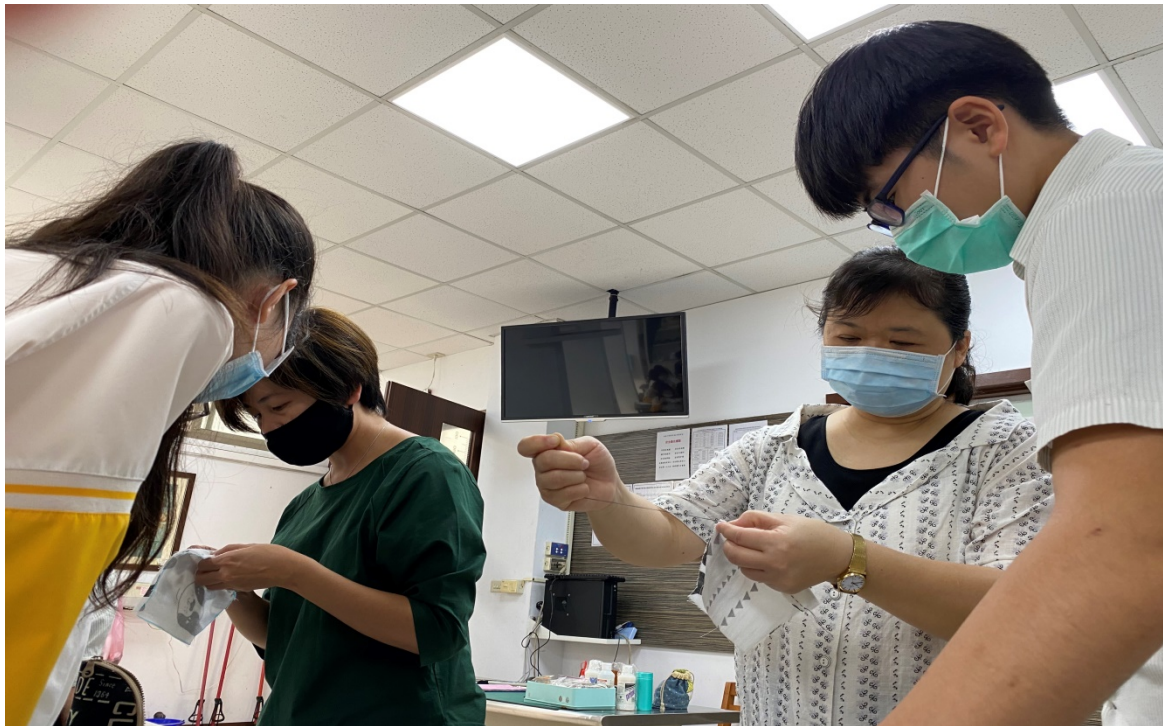
雙師分別指導上來詢問問題的學生