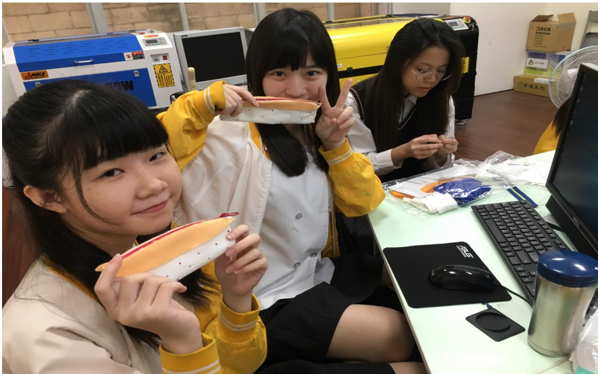
學生開心的展示自己的完成品