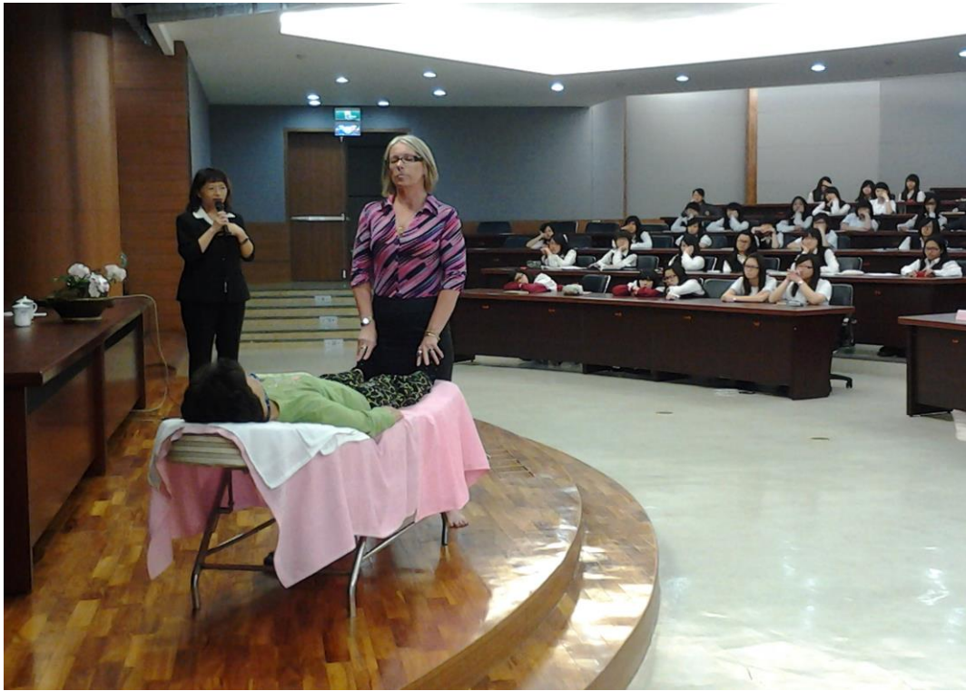
示範澳洲最新美容美體做法