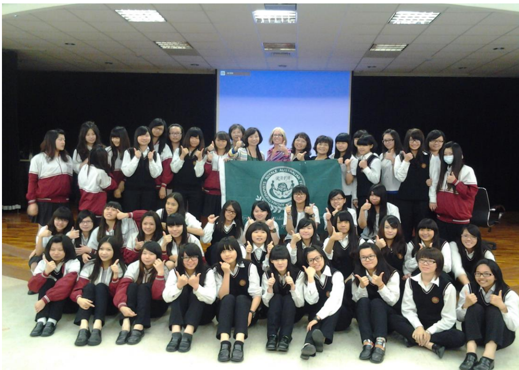
學生聽講後滿意的說讚